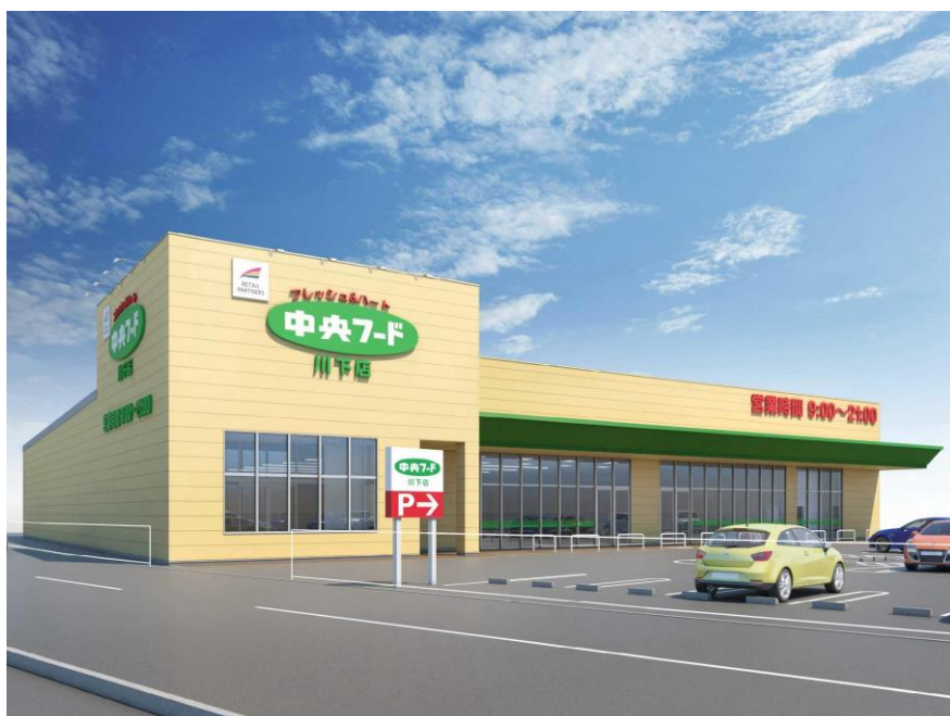
(店舗外観イメージ)